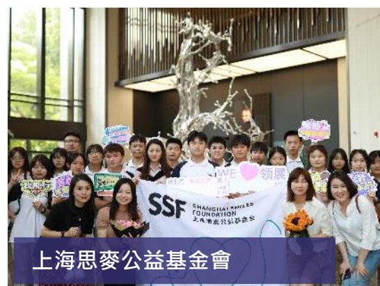
上海思麥公益基金會