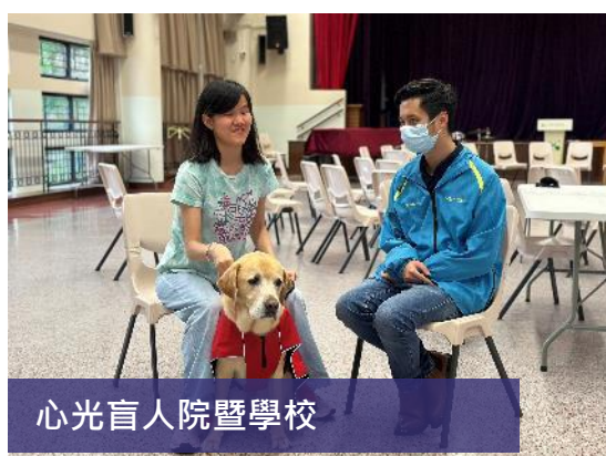
心光盲人院暨學校