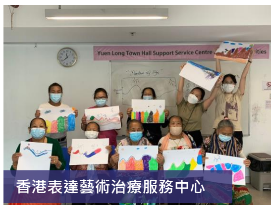
香港表達藝術治療服務中心