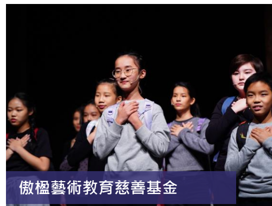
傲楹藝術教育慈善基金