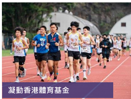
凝動香港體育基金